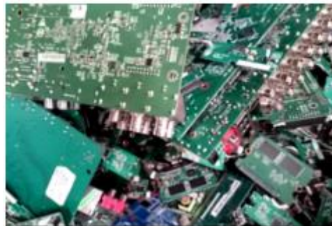
FIGURA 7 - Desmontagem dos materiais