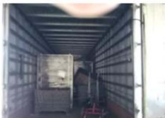
FIGURA 5 - Recebimento do material na GM&CLOG