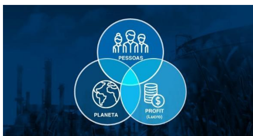
FIGURA 1 – Diagrama dos 3Ps da Sustentabilidade