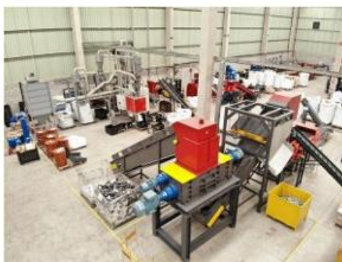
FIGURA 8 – Linhas de reciclagem para separação dos eletrônicos