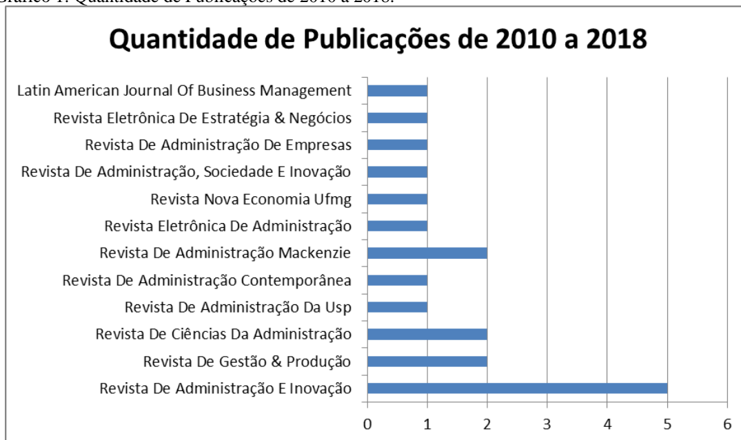
Gráfico 1: Quantidade de Publicações de 2010 a 2018.