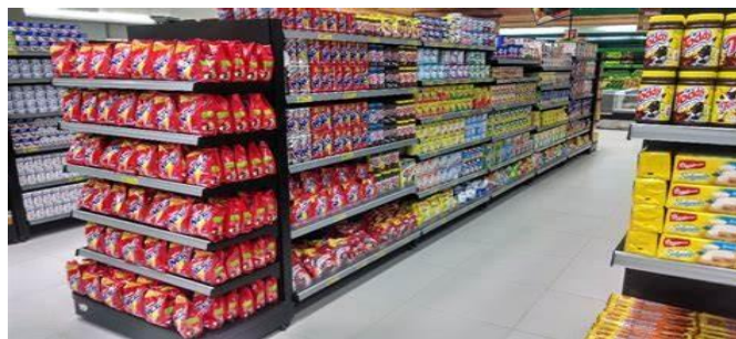
Figura 1 – Exemplo de gôndola