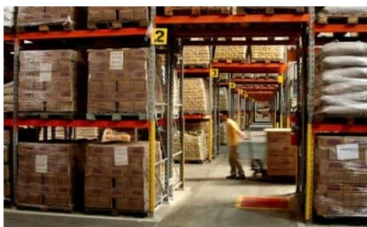
Figura 2 – Administração de materiais