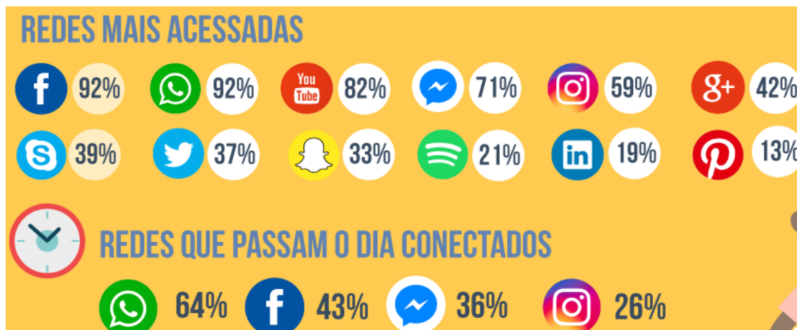
Figura 2 – Redes mais acessadas

Segundo fontes do site conarec.com (2016), a Qualisbest realizou uma pesquisa divulgando a utilização das redes sociais na vida dos internautas brasileiros. Como podemos ver na figura 2, o WhatsApp e o Facebook estão na liderança como um dos aplicativos mais acessados ao decorrer do dia. A sua rápida troca de informações e praticidade no envio das mensagens, podem contribuir altamente para uma interação maior entre o consumidor e a empresa, os produtos podem ser postados e compartilhados em questão de segundos, a propagação da empresa, produto ou serviço ocorre totalmente gratuita e ainda percorre o mundo inteiro.