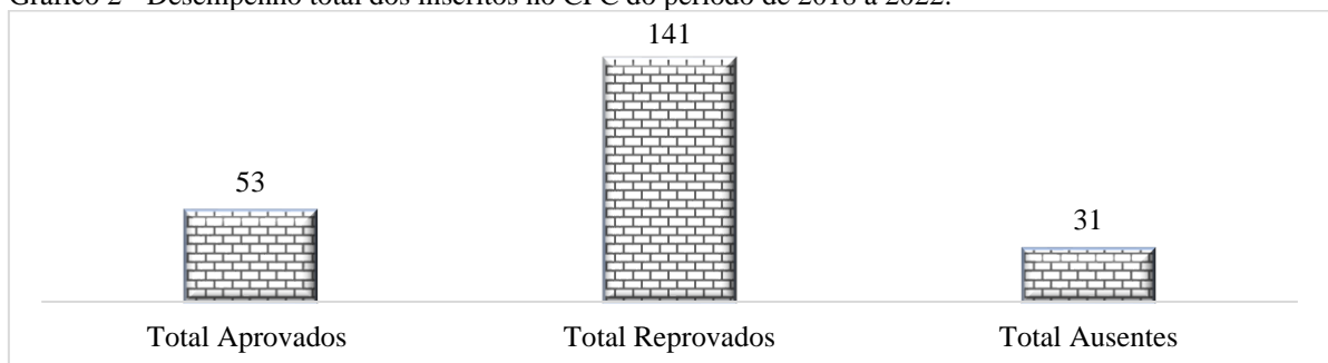
Gráfico 2 - Desempenho total dos inscritos no CFC do período de 2018 a 2022.

Nota-se um alto índice de reprovação, explicado na Tabela 3, no qual a maioria dos acadêmicos não se sentem apto a realizar o exame somente estudando exclusivamente o conteúdo das aulas, pois na Tabela 4 os resultados apontaram dificuldades na interpretação das questões. No Gráfico 2 é possível visualizar o desempenho total dos inscritos para o Exame de Suficiência.