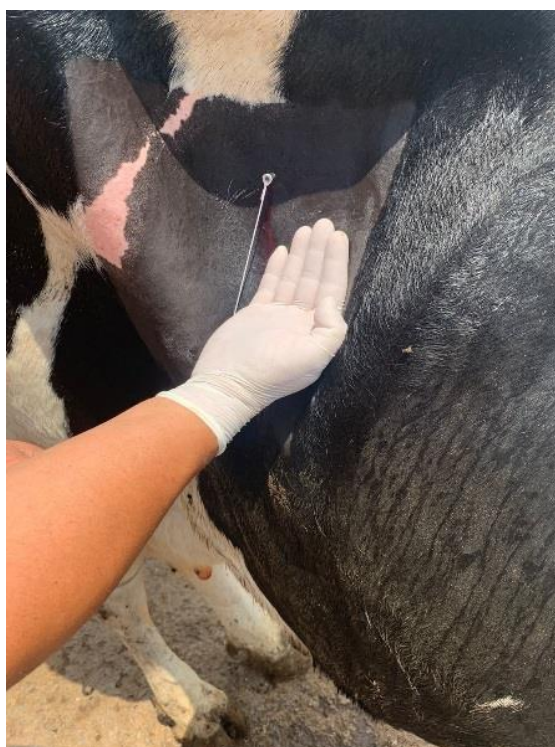
Figura 1: Apresentação da distância da incisão com a última costela.

Como forma de intervenção foi indicada a cirurgia de punção do abomaso pelo flanco direito. O procedimento teve início com uma antisepsia com iodo povidona 10%, diluído em água e, após esse processo, foi realizado a tricotomia, que é a retirada dos pelos evitando contaminação. Para fazer o bloqueio local, foram utilizados 3 (três) frascos de 50 ml de lidocaína 2% associado com epinefrina (vasoconstritor) e aplicado 150 (cento e cinquenta) ml (mililitros) em padrão L invertido no flanco direito (Figura 1 e 2).