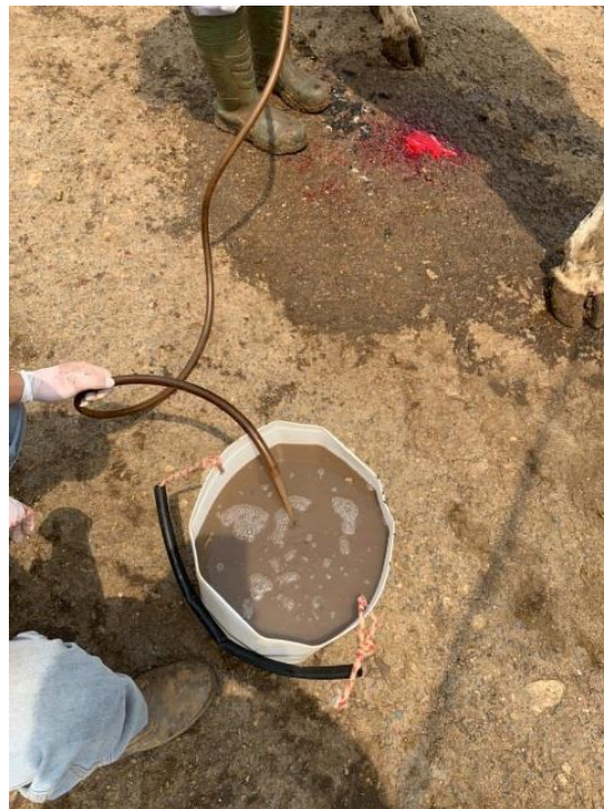
Figura 7: Líquido retirado do abomaso.