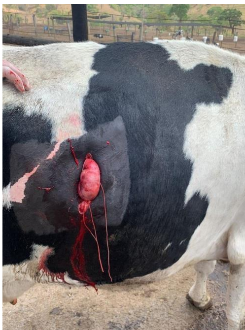
Figura 5: Abomaso exposto fixado à musculatura para auxiliar na punção.

Na sequência foram retirados os pontos de apoio que estavam fixando o abomaso a musculatura para auxiliar o procedimento e impulsionou-se o abomaso ventralmente fazendo com que retornasse ao lado direito da cavidade, em sua posição normoanatômica, sem utilizar qualquer procedimento de pexia relatada na Figura 5.