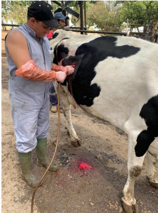
Figura 6: Passagem de sonda.

Logo após a exposição do abomaso, foi introduzida uma sonda para a retirada de líquido e gases, com auxílio do cateter nº14, conforme demonstra as Figuras 6 e 7.