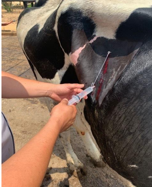
Figura 2: Bloqueio anestésico.