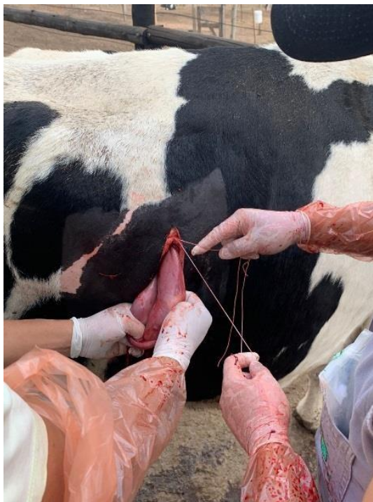
Figura 4: Exposição e sutura para regressão do abomaso.

Na sequência foram retirados os pontos de apoio que estavam fixando o abomaso a musculatura para auxiliar o procedimento e impulsionou-se o abomaso ventralmente fazendo com que retornasse ao lado direito da cavidade, em sua posição normoanatômica, sem utilizar qualquer procedimento de pexia relatada na Figura 5.