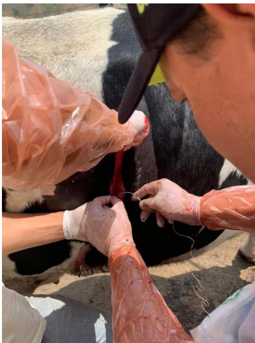
Figura 8: Sutura da parede do abomaso.

A Figura 8, que finaliza o procedimento, mostra o fechamento do acesso com duas camadas de sutura, sendo a primeira com simples contínuo (coaptante) e a segunda camada com a sutura de lembert contínua (invaginante).