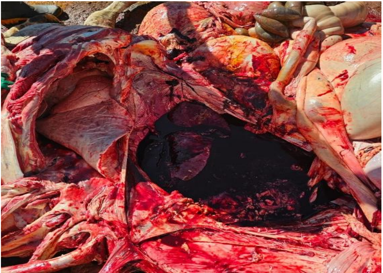
Figura 5: Cavidade abdominal apresentando superfície serosa dos órgãos embebidas por hemoglobina e cavidade contendo coágulos.