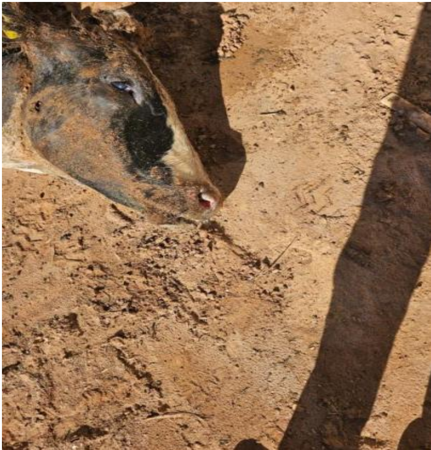
Figura 3: Avaliação externa da cabeça, principalmente as narinas, com observação de secreção sanguinolenta