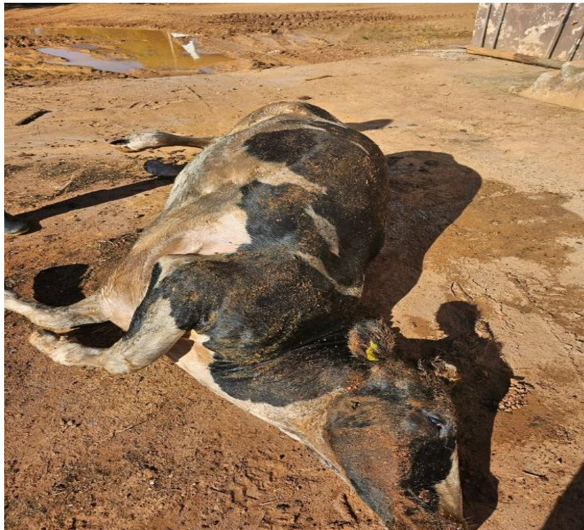
Figura 2: Avaliação da condição externa do animal no pós morte.

Durante a avaliação externa do cadáver observou-se condição corporal adequada, sem evidências de escoriações, fraturas ou hematomas superficiais (Figura 2). Entretanto, verificou-se presença de secreção sanguinolenta associada a conteúdo alimentar nas narinas (Figura 3), achado frequentemente relacionado à insuficiência cardiorrespiratória terminal e morte súbita (MCGAVIN; ZACHARY, 2017).