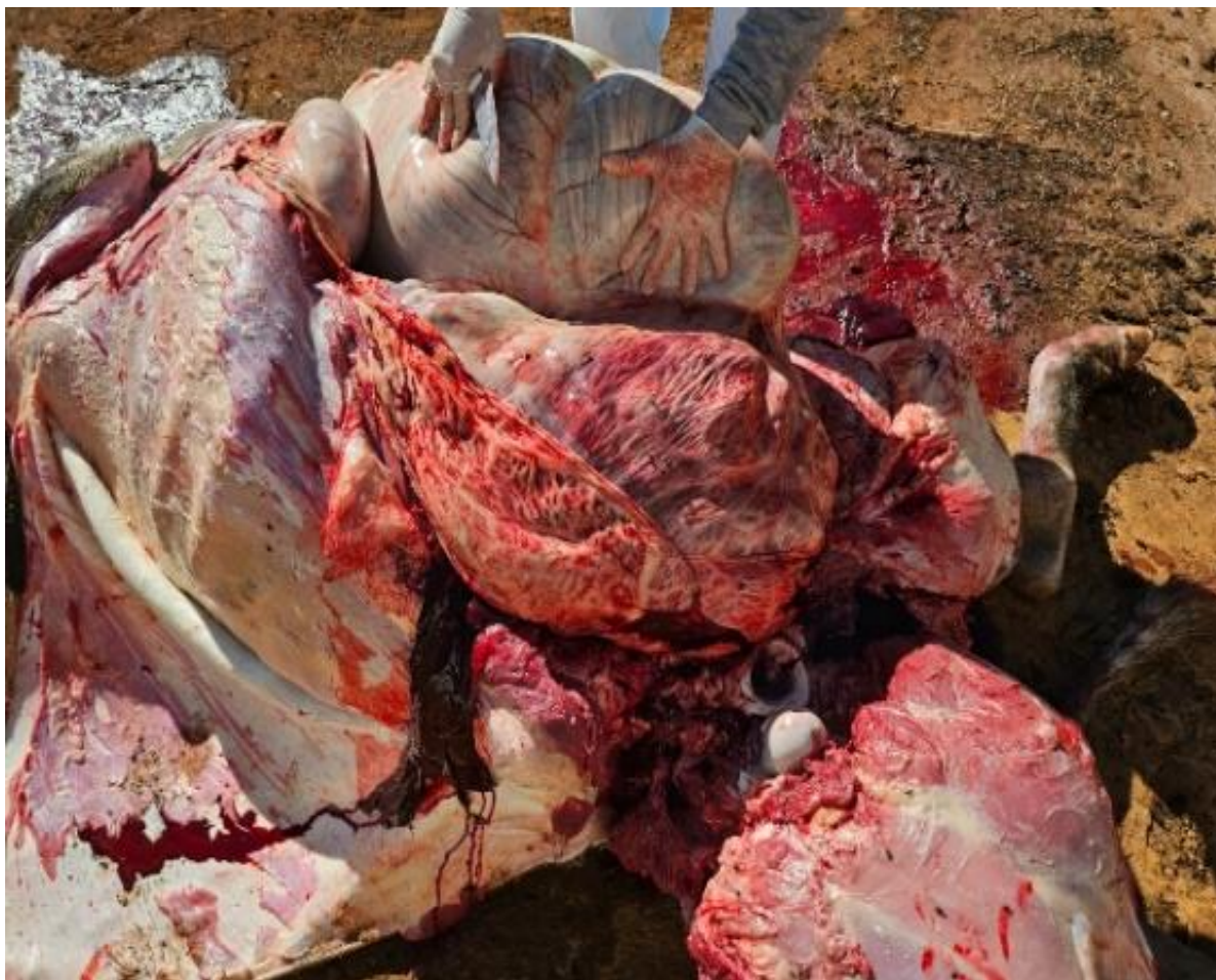
Figura 4: Cavidade abdominal mostrando peritônio hemorrágico e sangue em todo espaço.