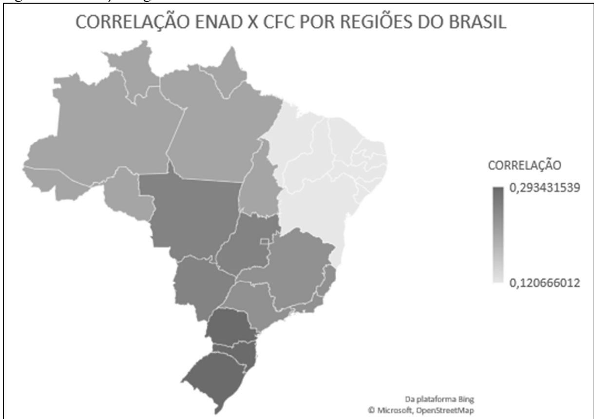
Figura 2: correlação regional