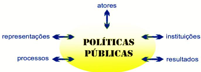
Figura 1 - Representação gráfica das políticas públicas

Fundamentalmente, a eficácia de uma política pública reside na convergência de interesses plurais em torno de um projeto coletivo. Em contextos de vulnerabilidade social, essa articulação torna-se o alicerce para que as diretrizes educacionais transcendam o papel e promovam transformações palpáveis. Nesta perspectiva, cabe ao gestor escolar a tarefa de mediar essas tensões, convertendo a diversidade de demandas em uma agenda comum de desenvolvimento humano.