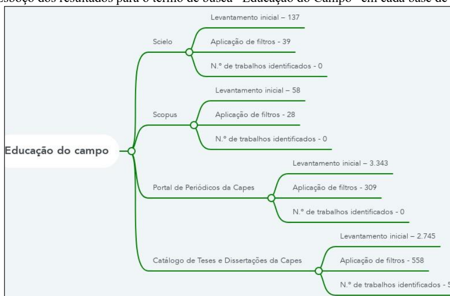
Figura 1: Esboço dos resultados para o termo de busca “Educação do Campo” em cada base de dados