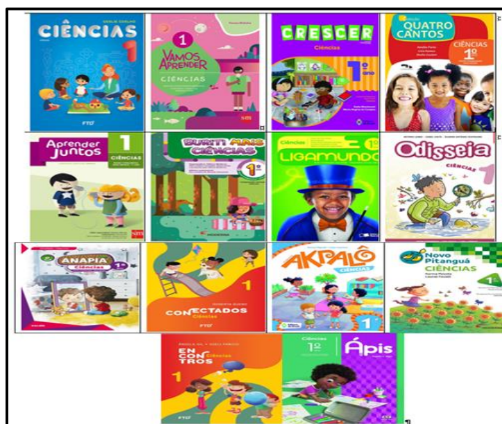
Figura 1 – Capa das obras aprovadas Edital 01/2017 PNLD 2019