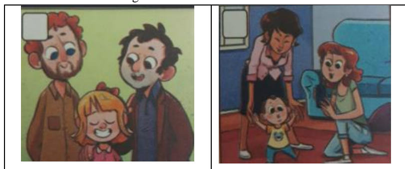
Figura 4 – A família de cada um

Já na Figura 4 podemos perceber e identificar que o livro didático “Aprender Juntos” traz em suas imagens algumas rupturas ao apresentar as famílias homoafetivas.