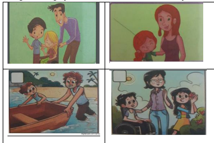
Figura 3 – Agrupamento do modelo de família monoparental