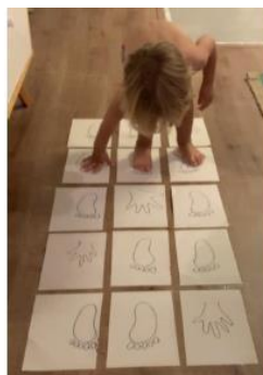
Figura 4. Atividade Direito de Aprendizagem – Explorar

A convivência com crianças e adultos é fundamental para o desenvolvimento infantil. O distanciamento social precariza essas relações sociais, mas não impede de ser estimulado em casa. O Ensino Remoto de Emergência se preocupou em estimular o contato social com irmãos pais e/ou responsáveis, sem precisar sair de casa para isso. A Figura 3 demonstra que o direito de conviver foi contemplado através de brincadeiras que podem ser realizadas em conjunto.